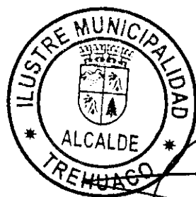
PAUL ESPEJO ESCOBAR ALCALDE