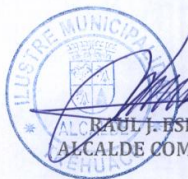
RAUL J. ESPEJO ESCOBAR ALCALDE COMUNA DE TREHUACO