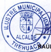
RAÚL ESPEJO ESCOBAR ALCALDE