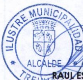
RAÚL ESPEJO ESCOBAR ALCALDE I. MUNICIPALIDAD DE TREHUACO