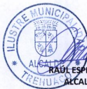
RAUL ESPEJO ESCOBAR ALCALDE