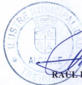
RAUL ESPEJO ESCOBAR ALCALDE