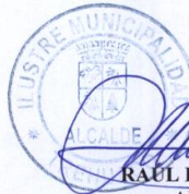
RAUL ESPEJO ESCOBAR ALCALDE